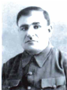
Loris Papikian (1903, Erzéroum)