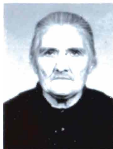
Barouhi Silian (1900, Nicomédie)