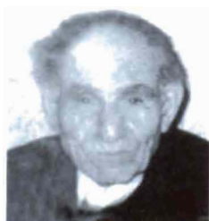
Hrant Gasparian (1908, Mouch)