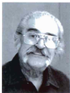
Hacop Ter-Poghossian (1920, Dyortyol)