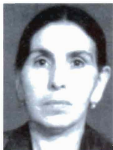
Srbouhi Kikichian (1909, Arabkir)