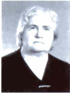
Vergine Taghavarian (1898, Sébaste)