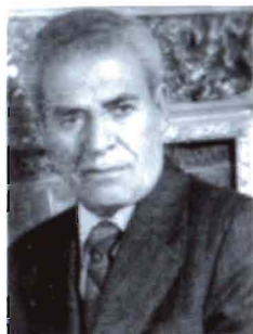
Soghomon Eténikian (1900, Mersine)