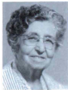
Paytzar Erkat (1887, Césarée)