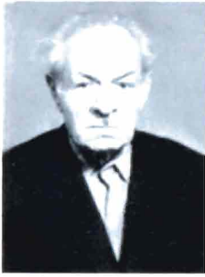
Kamsar Khatchatrian (1898, Bayazet)