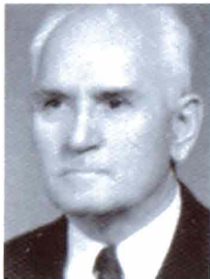
Souren Sargsian (1902, Sébaste)