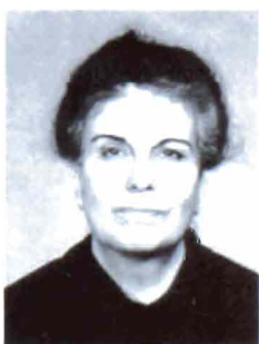
Chaké Zoulalian (1914, Constantinople)