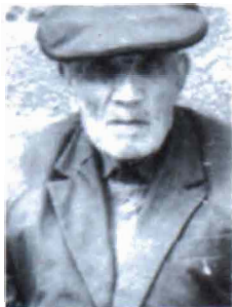
Hovhannes Paronian (1890, Eskichéhîr)