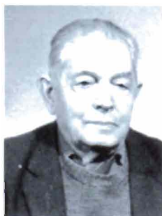
Sarkis Khatchatrian (1903, Kharberd)