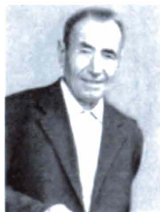
Tonakan Tonoyan (1893, Mouch)