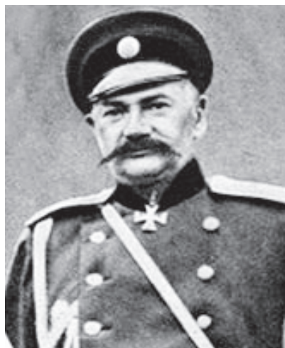
Գեներալ Պյոտր Օզանովսկի