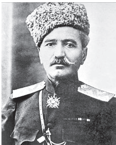
Գեներալ Անդրանիկ Օզանյան