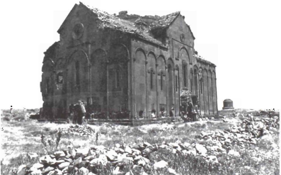
Աճիկ Մայր Տաճարը , 980