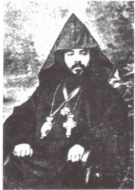
Սմբատ եպիսկոպոս Սաստեթյան

Օրմանյան ևս իր առաջին առաջնորդական պաշտոնավարությունը կատարում է Կարինի Քհնում, 1880—1887 թվականներին: