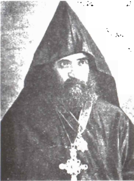
Խոսրով եպիսկոպոս Բեհրիկյան

Ավագանի անունով Խաչատուր, բնիկ զարեցի Արմաշի զպրեզիանքի ավագ սերնդի ներկայացուցիչ և առաջին շրջանի (1889—1895) յոթներեն մին («Խոհճք և խոսք», էջ 442):