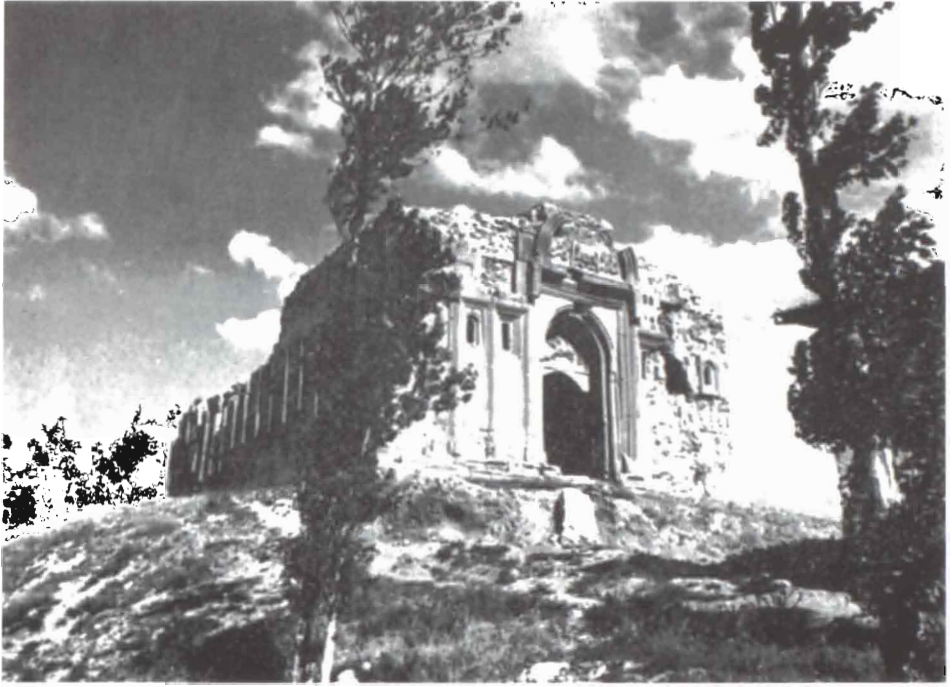
Ս. Բարբաղիմեոս վանքը