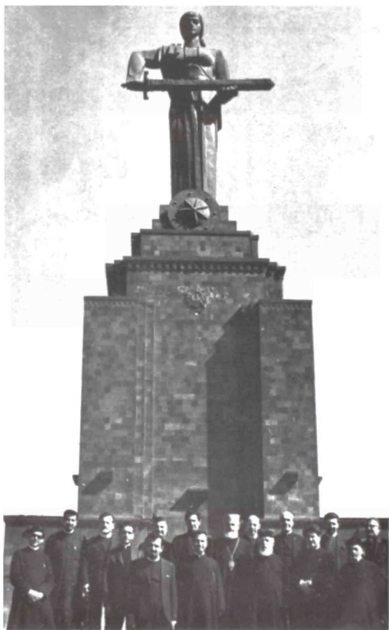
Հայ Հոգեւորականներ Երեւանի «Մայր Հայաստան»ի Յուշարձանին Առջեւ