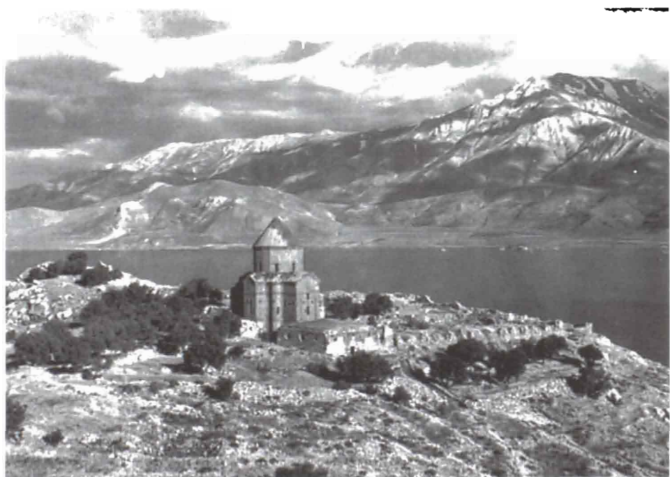
Ախթամարի վանքը , 915-921