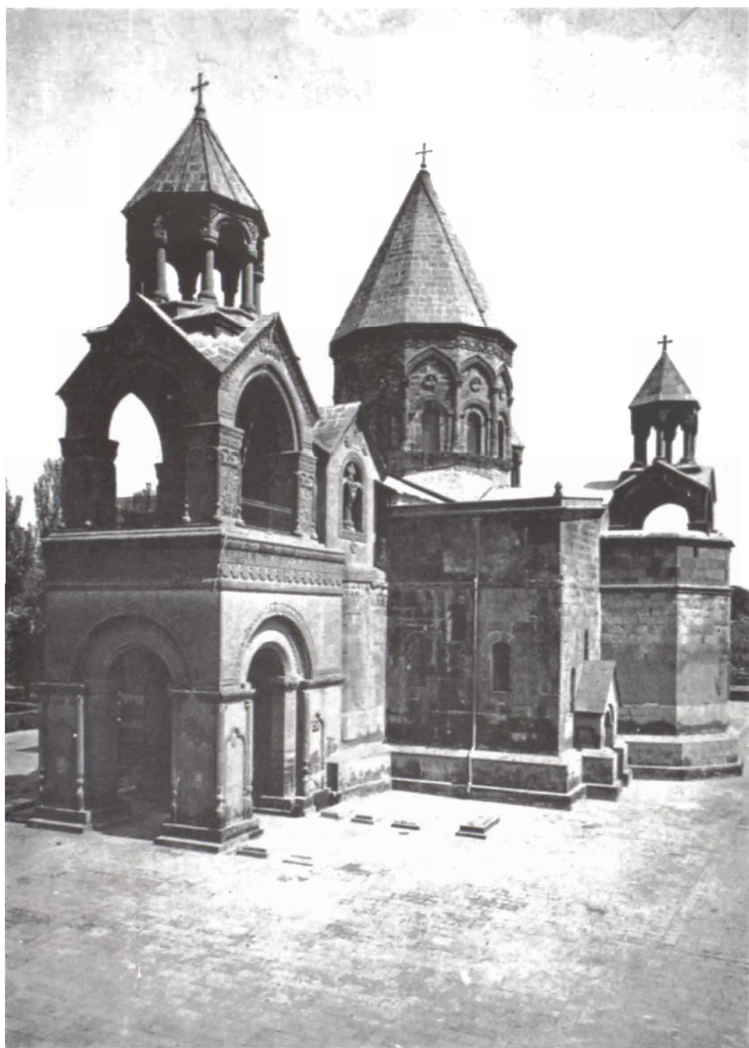
Մ. Էջմիածնի Մայր Տաճարը