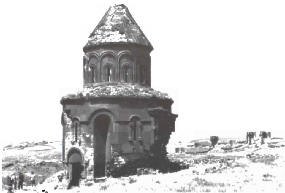
Պրիգոր Ապուղամբենցի եկեղեցին, ձ դար