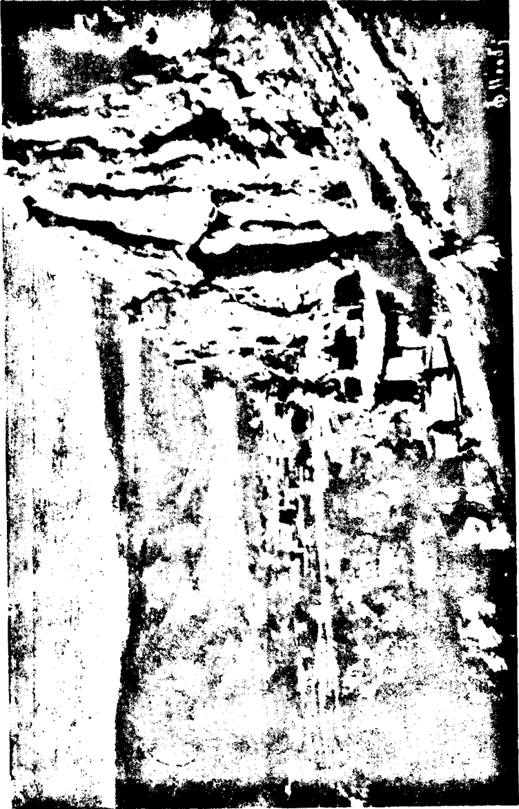
Գարխ (1900-ական թվականներ)