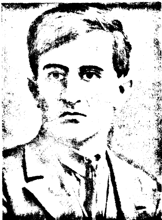
Ա. Բակունց (1931 թ.)